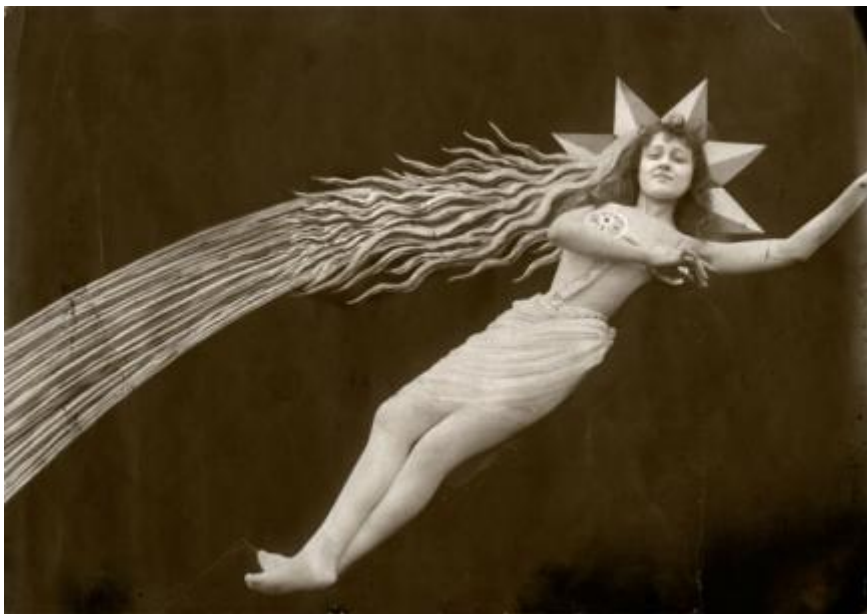
Georges Méliès, Eclipse du soleil en pleine lune (Visuel consultable à la Bibliothèque du film)